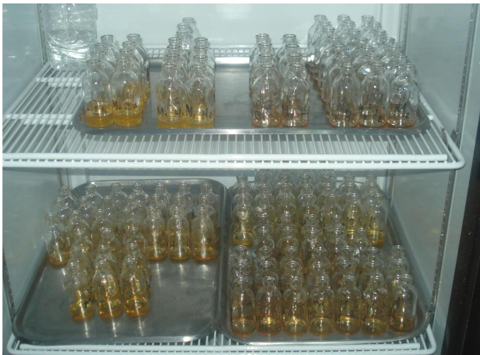
Figura 7. Charolas con Extracciones de las 5 muestras en refrigeración.