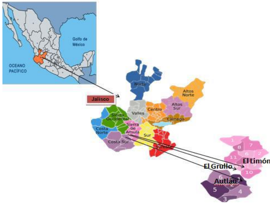
Figura 1. Ubicación del área de estudio del valle Autlán-El Grullo, Jalisco